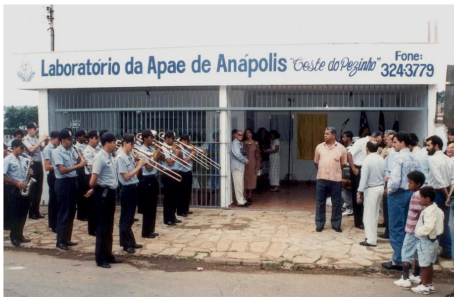
Inauguração do Laboratório da APAE Anápolis, o primeiro no Centro-Oeste a realizar o Teste do Pezinho.

Novembro de 1994: É inaugurado o Laboratório da APAE Anápolis, com a finalidade de prevenir a deficiência intelectual no Estado de Goiás através da realização do Teste do Pezinho.