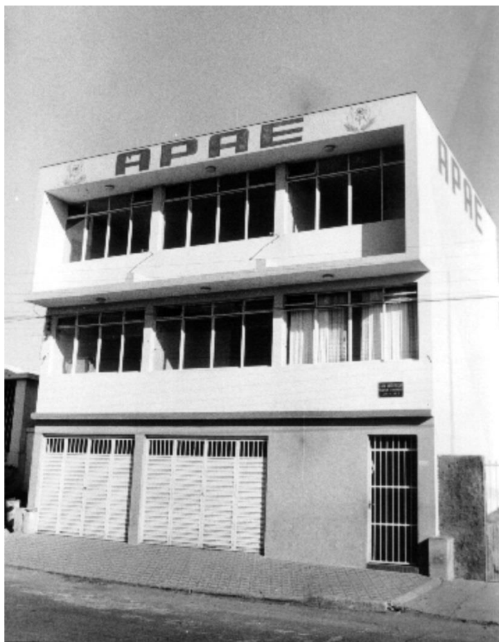
Prédio que abrigou a escola por 26 anos

Março 1972: Inauguração da sede própria, que abrigaria a escola por 26 anos.