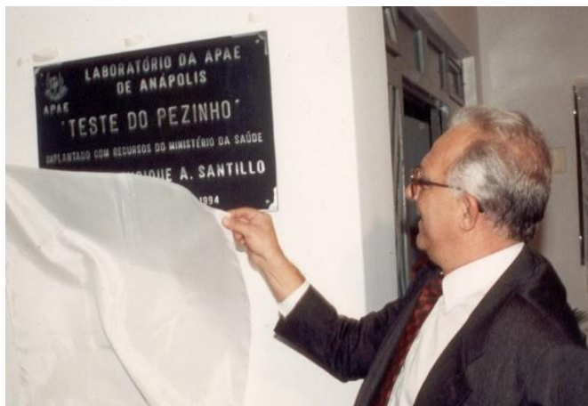
O então Ministro da Saúde Henrique Santillo descerra a placa comemorativa, inaugurando o Laboratório da APAE Anápolis

1998: A Escola Maria Montessori passa a usufruir de novas e modernas instalações, localizadas no Setor Bougainville, em Anápolis. O antigo prédio da escola, após uma completa reforma e adaptação, passou a abrigar definitivamente o Laboratório da APAE.